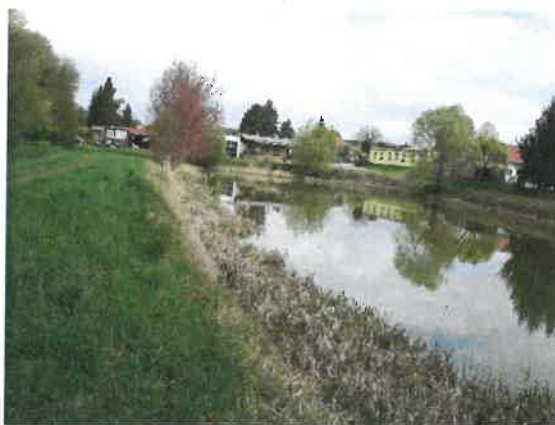
Rybníček na Rybářské Baště