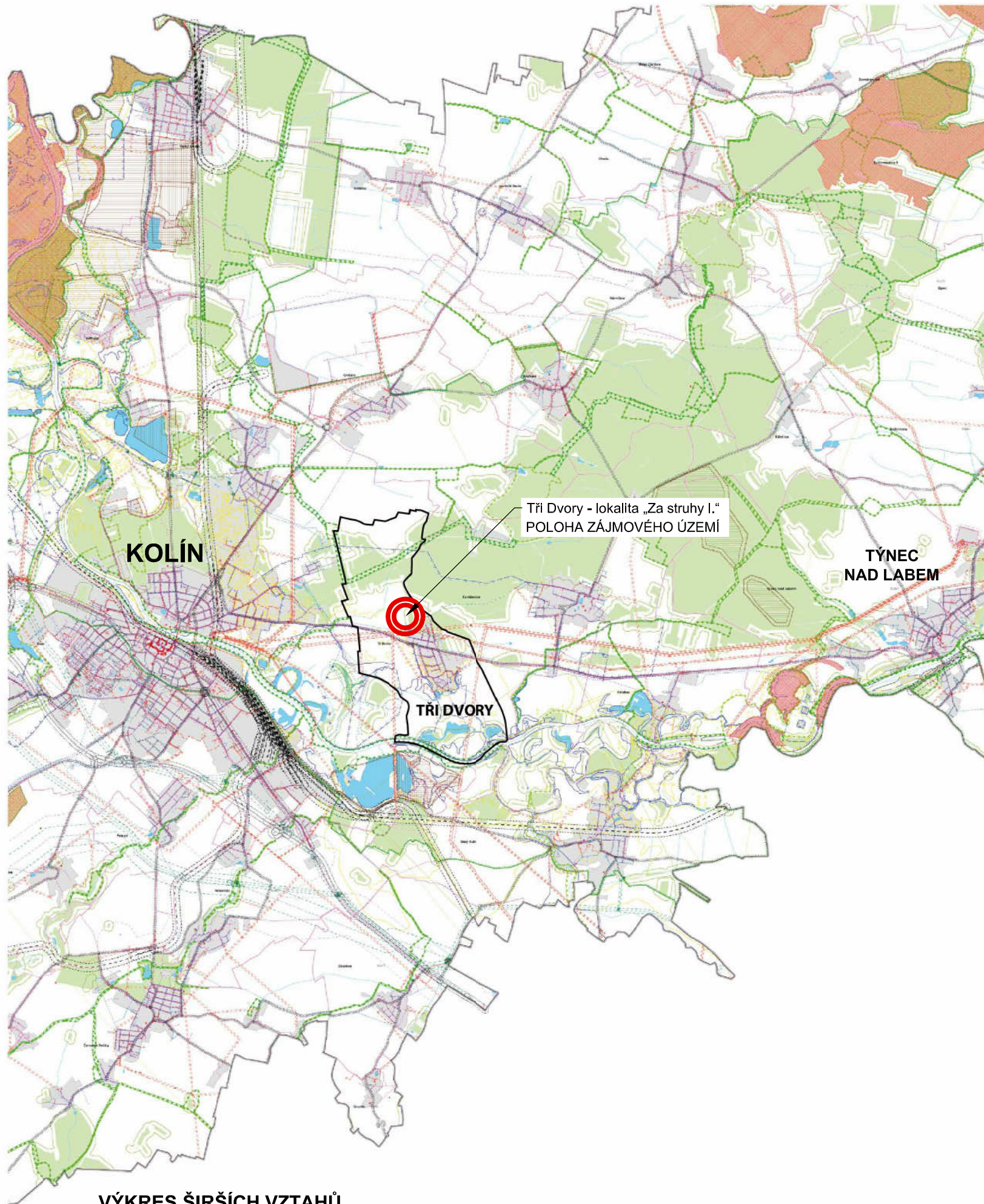
VÝKRES ŠIRŠÍCH VZTAHŮ